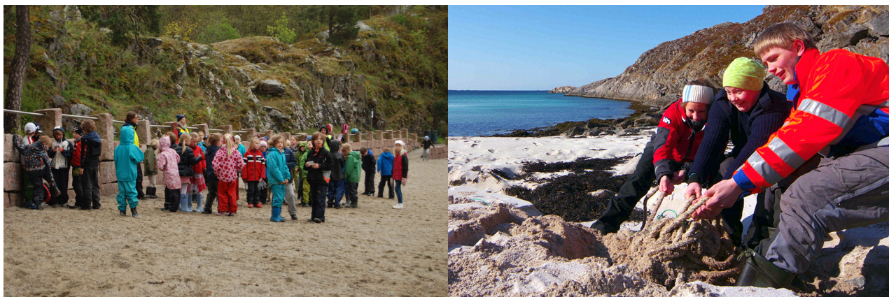
Store og små bidro med å rydde strender under Strandryddedagen 2015.

Rekruttering, veiledning og oppfølging av frivillige i forbindelse med ryddeaksjoner utgjør en stor del av Hold Norge Rents arbeid og er avgjørende for at Strandryddedagen og øvrig rydding skal videreføres og øke i omfang.