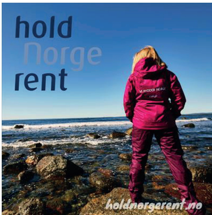
Hold Norge Rents informasjonsbrosjyre.

I samarbeid med JS Norge produserte Hold Norge Rent en informasjonsbrosjyre om foreningen og foreningens arbeid. Brosjyren ble trykket i et opplag på 2 500 og var fullfinansiert av annonser fra Hold Norge Rents støttespillere.