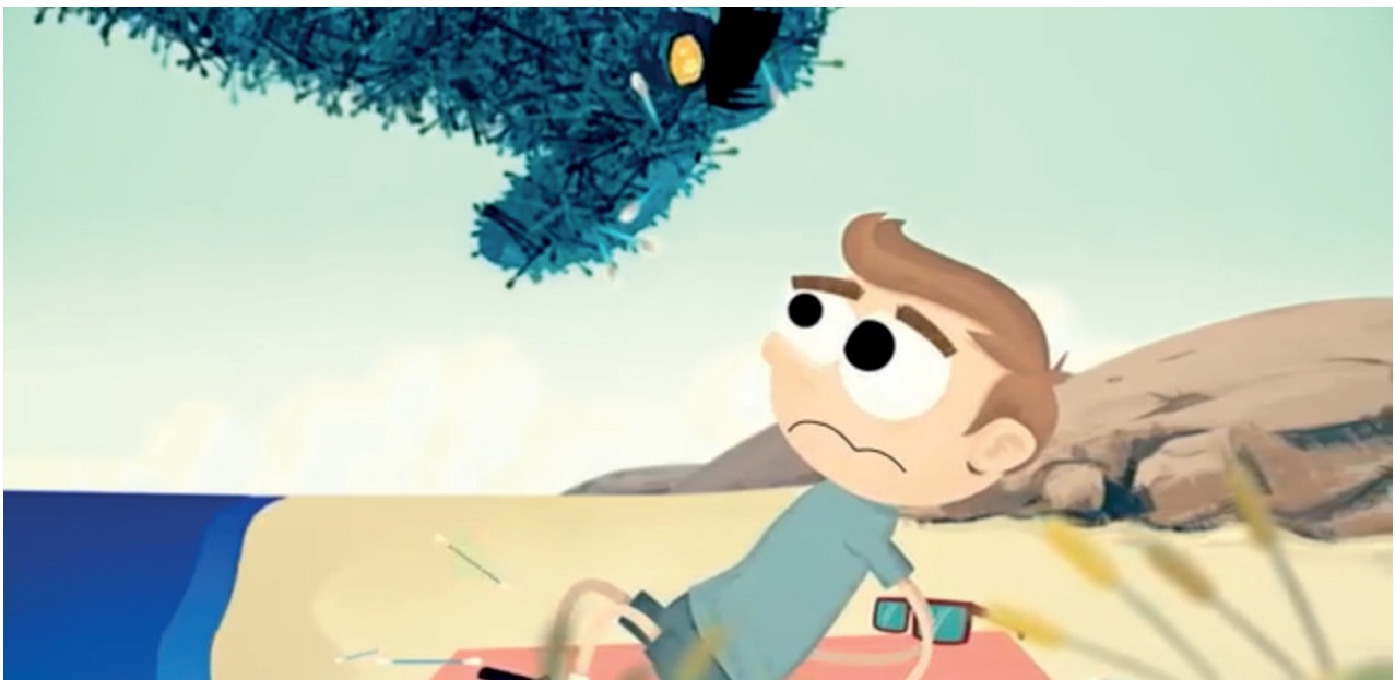
Utsnitt av kampanjefilmen "Vis Dovett".

Hold Norge Rent har også opprettet en faktside om dovett på holdnorerent.no . Denne siden er nå i flittig bruk.