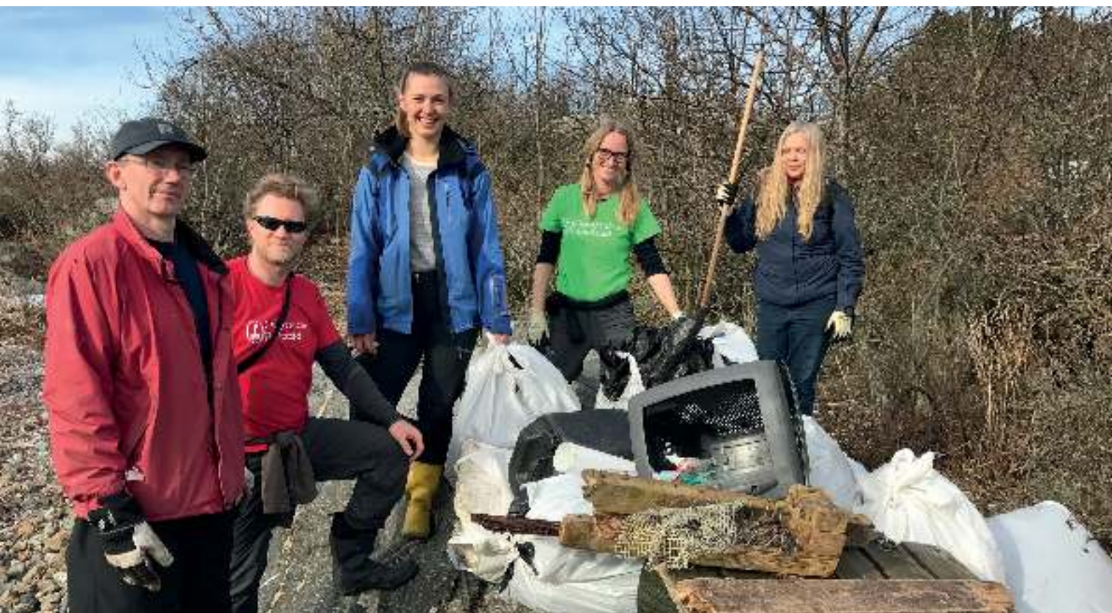
Før fuglene kommer 2017 - Ryddeaksjon i Drøbak med Oslofjordens Friluftsråd.

Prosjektet ble gjennomført med tilskudd fra Miljødirektoratet og støtte fra Sparebankstiftelsen DNB.