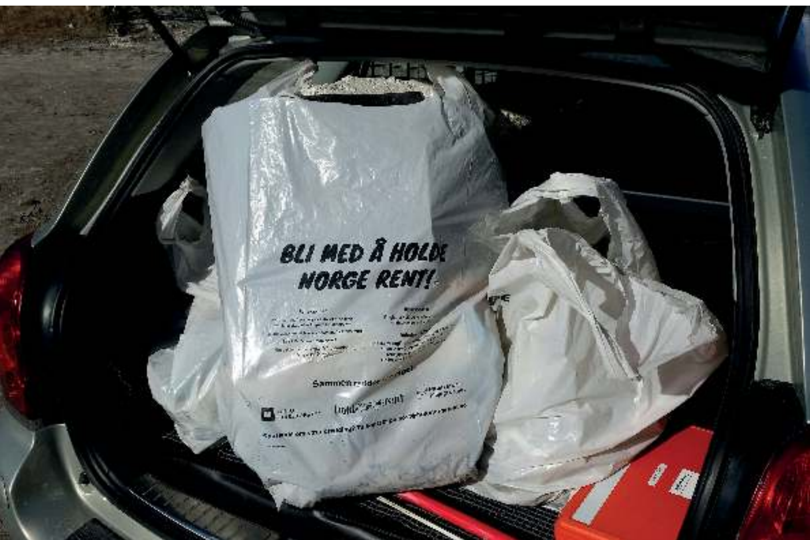
Frivillige i Bodø bruker Hold Norge Rents ryddepakker.

På sikt er målet å distribuere ryddepakkene via lokale og regionale distributører over hele landet. Arbeidet med å etablere dette nettverket startet opp i 2017.