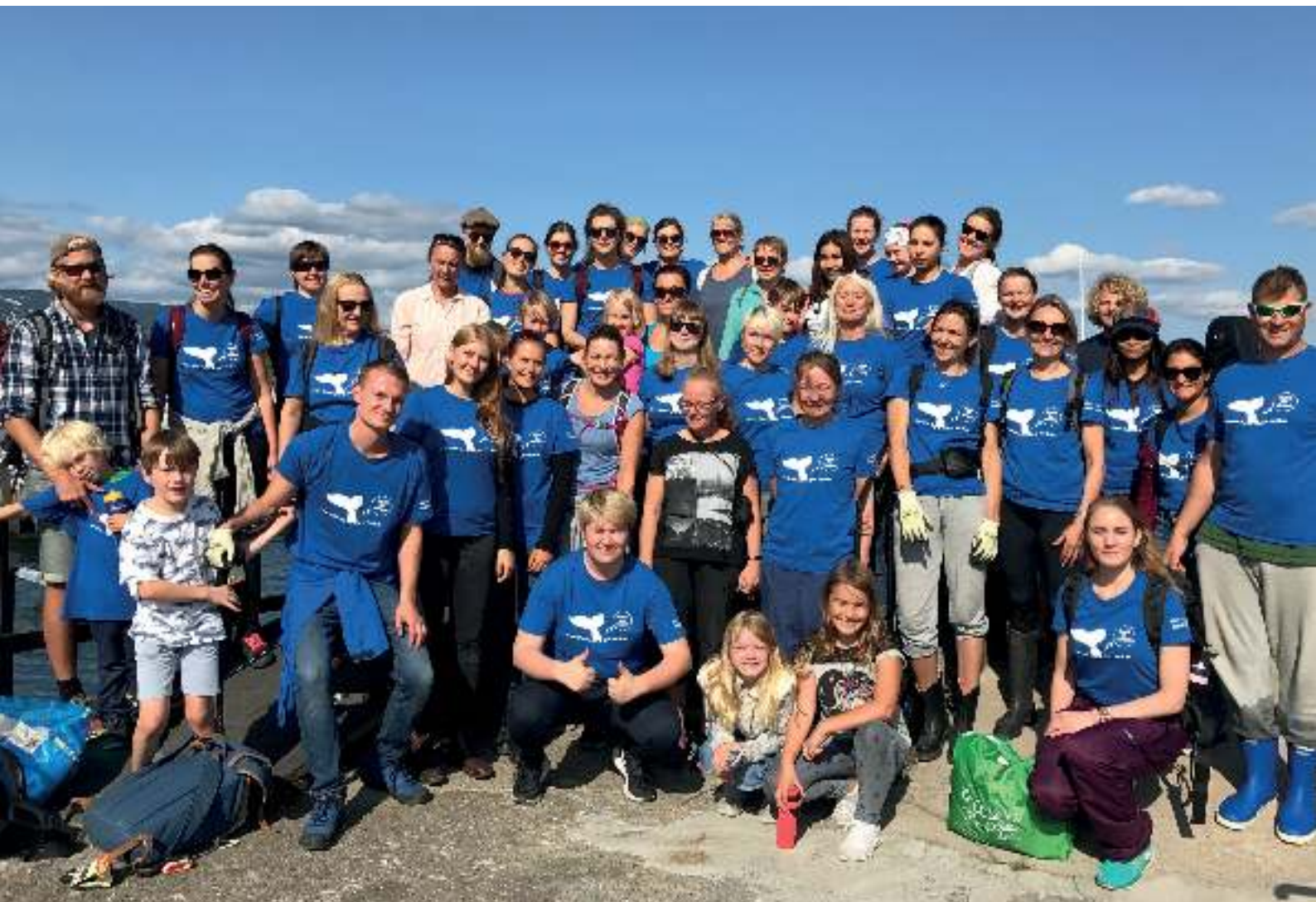
Hold Norge Rents ryddeaksjon under Passion for Ocean 2017.