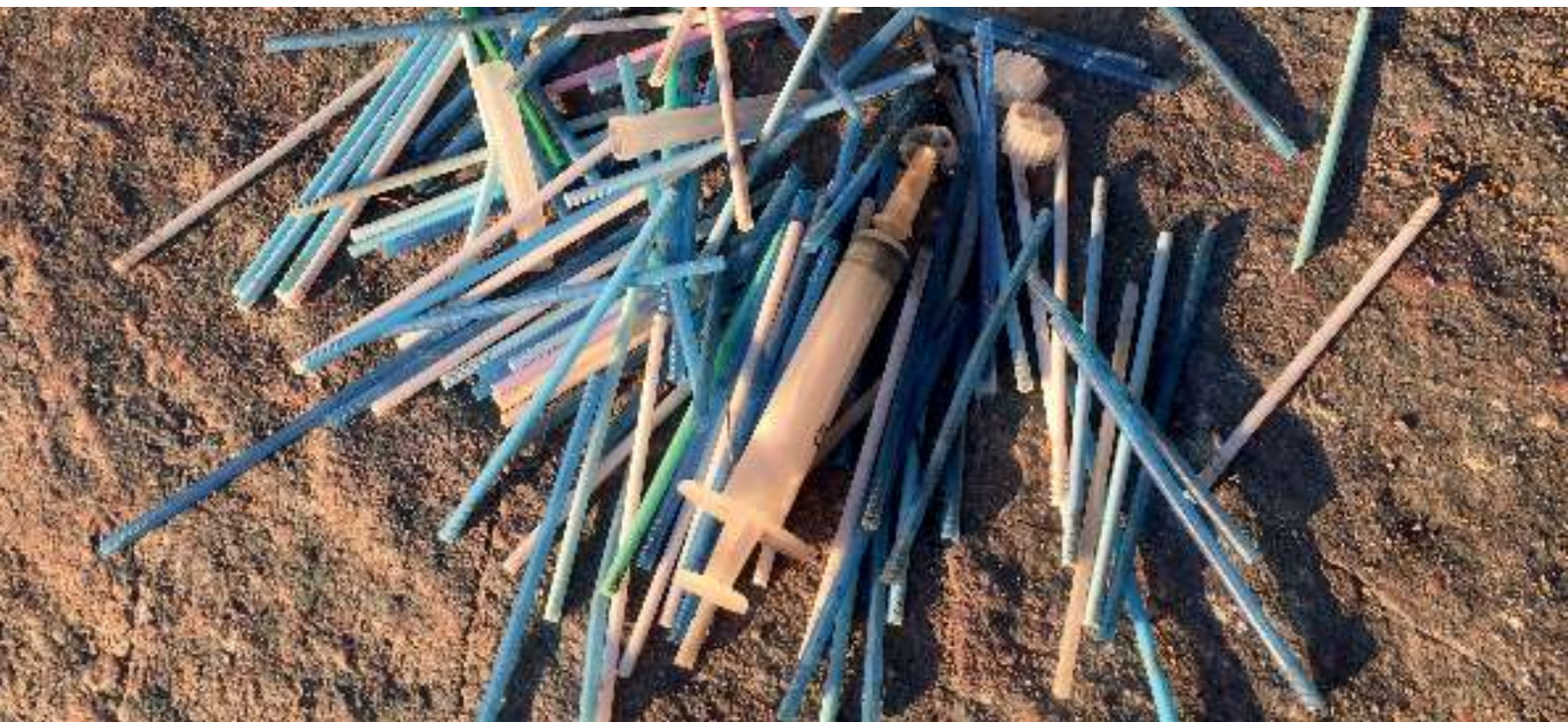
Dosøppel funnet langs Oslofjorden under Hold høsten ren 2017.

Bruk av toalettet som avfallsbøtte er også en stor kilde til forsøpling i Norge. Dovettkampanjen ble lansert i 2016, og arbeidet med dovett ble videreført i 2017. Målet er å synliggjøre konsekvensene av å bruke toalettet som avfallsbøtte, samt å motivere folk flest til å plassere avfallsbøtter på badet.