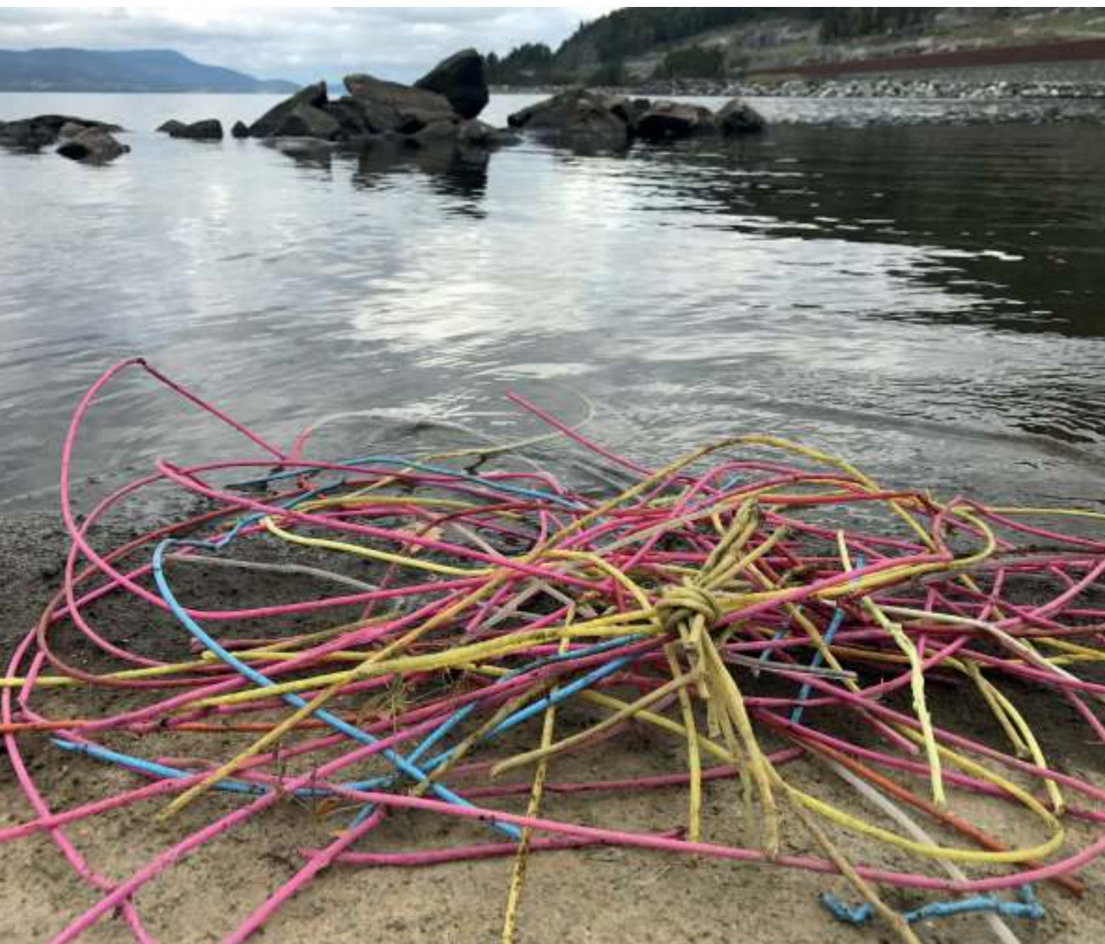
Sprengtråder i plast funnet langs Mjøsa under Hold Norge Rents ryddeaksjon ved Minnesund.

For øvrig danner disse ryddeaksjonene grunnlaget for videre metodeutvikling, videre utvikling av Ryddeportalen og kvalitetssikring av data.