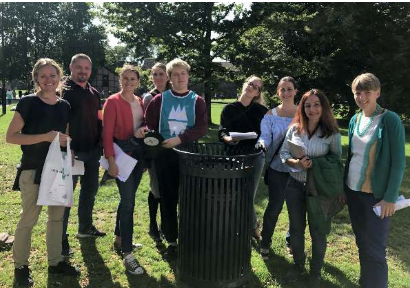
Kurs i kartlegging av forsøpling.

Prosjektet finansieres med støtte fra Plastreturs Miljøprosjekt og gjennomføres i samarbeid med Kristiansand kommune, Karmøy kommune, Ålesund kommune, Nordkapp kommune og Statistisk sentralbyrå