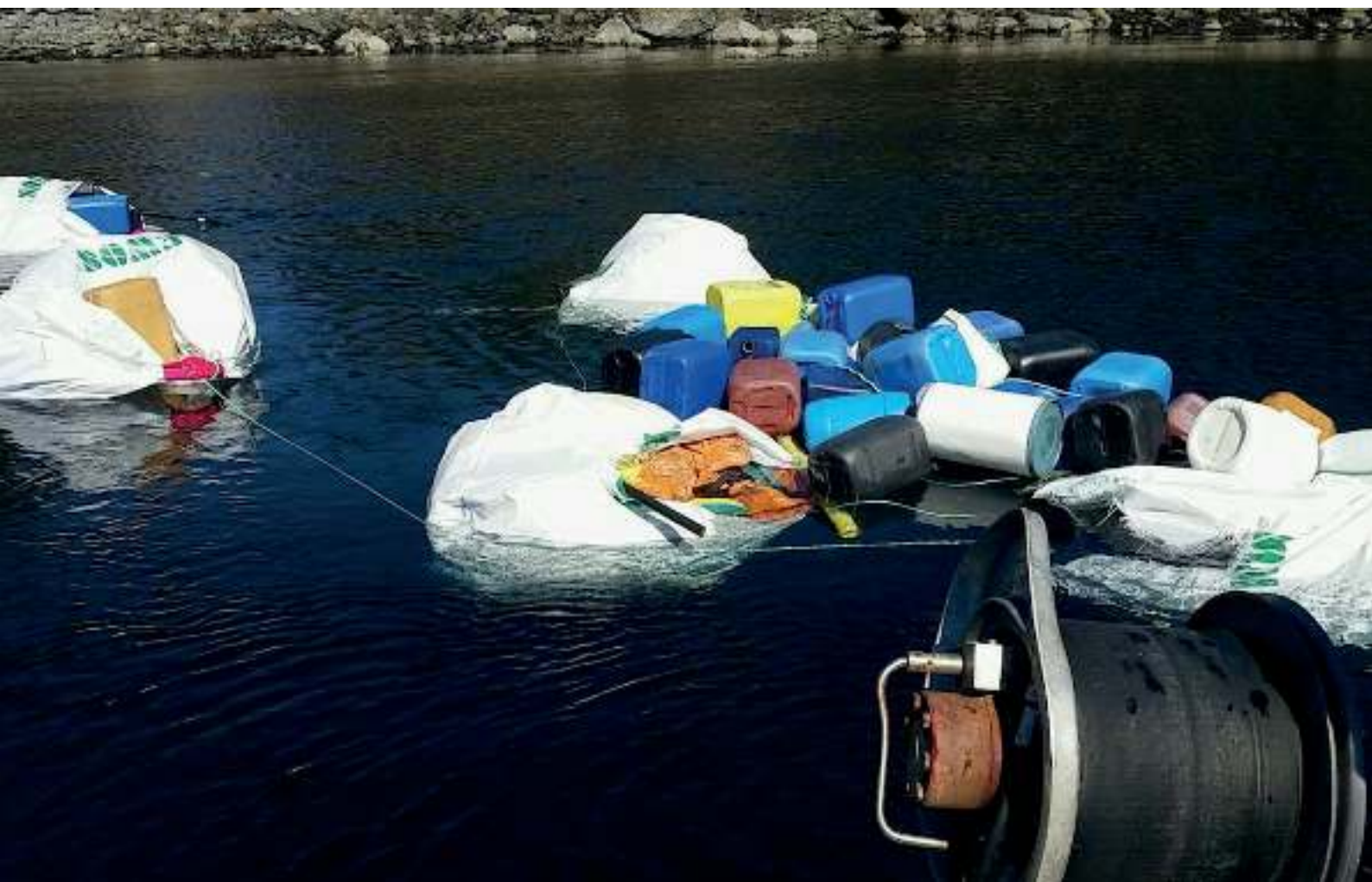
Askrova Bygdelag rydder i forbindelse med Strandryddedagen 2017.

Prosjektet ble gjennomført med tilskudd fra Miljødirektoratet.