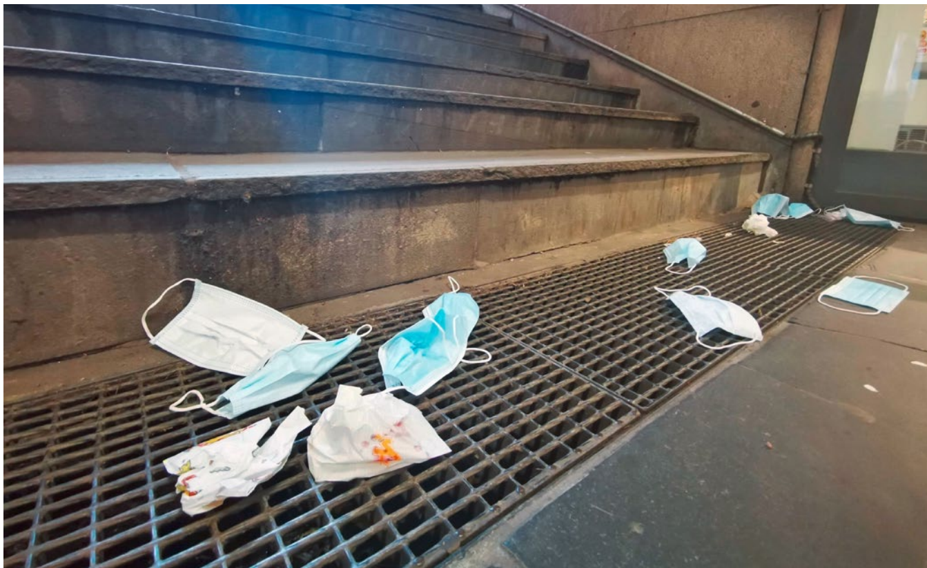
Munnbindforsøpling i Oslo høsten 2020.