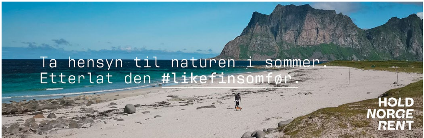
Hold Norge Rent lanserte dugnaden #likefinsomfør i 2020.