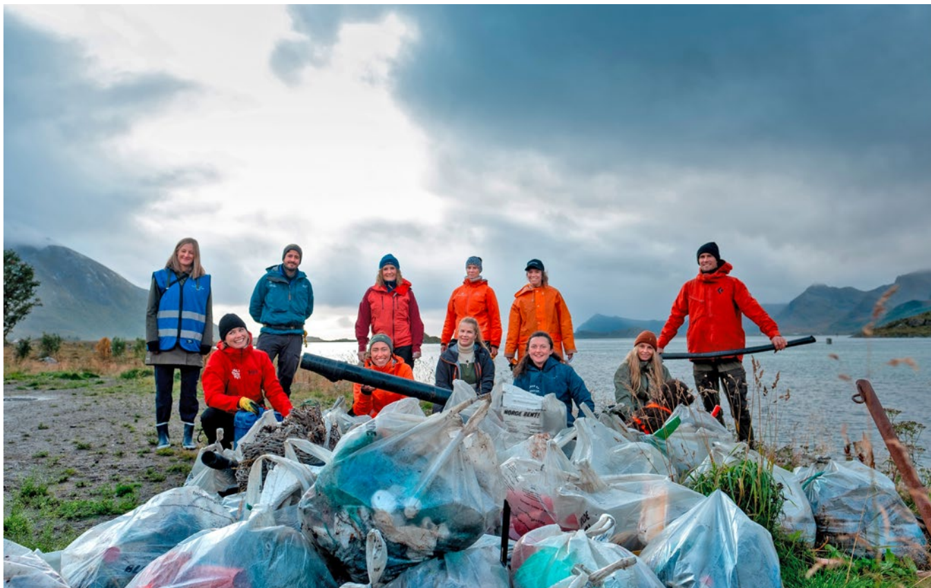
Hold Norge Rent markerte tiårsjubileet for Strandryddedagen med en ryddeaksjon i Lofoten i samarbeid med Senter for oljevern og marint miljø og Lofoten Avfallsselskap.