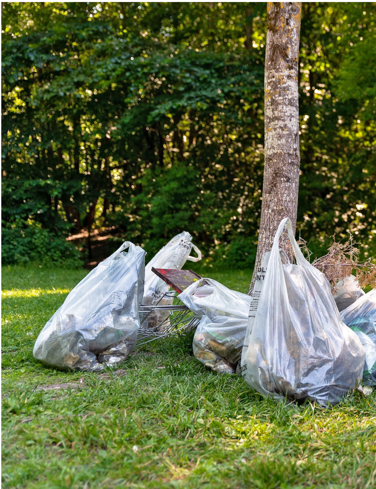
Hold Norge Rents administrasjon ryddet langs Alnaelva i Oslo i juni.